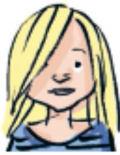
Wilma Ålder: (x - 2) år Längd: (y + 3) cm

1 a) Vad menas med uttrycket (x - 2) år? _____