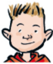
Anton Ålder: x år Längd: y cm